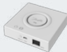
Danfoss Ally™ LAN Gateway App-Steuerung