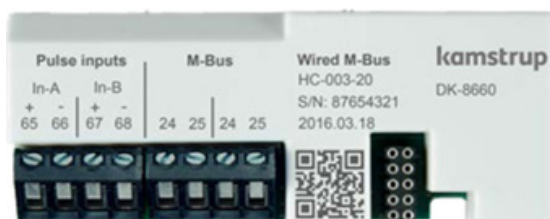
Module M-Bus (00377180)

Plus d'informations sur l'alimentation de modules dans le Multical 403/603 chez fiche techniques sur: www.techem.ch/fr/liste-de-prix