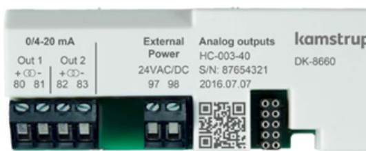
Module de sortie analogique 0/4...20 mA (00377188)