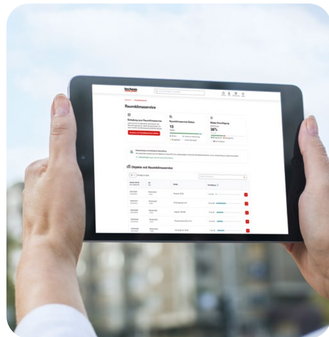
Beispielhafte Darstellung Vermieter-Dashboard

Damit der Raumklimaservice genutzt werden kann, übernimmt Techem für Sie den gesamten Einwilligungsprozess: Sie starten ihn einfach über das Kundenportal, anschließend erhalten die Bewohnenden automatisch ihre persönliche Registrierungseinladung und können der Verarbeitung der Raumklimadaten zustimmen.