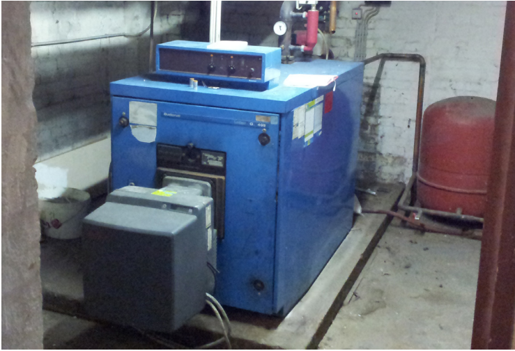
Vor der Sanierung