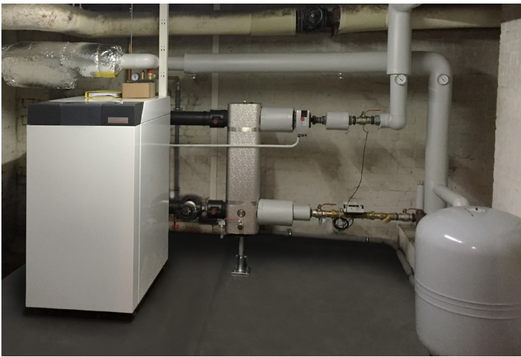
Nach der Sanierung