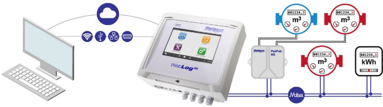
Fernzugriff per Webbrowser